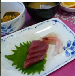
20日：お刺身 (ベテルお楽しみ献立)