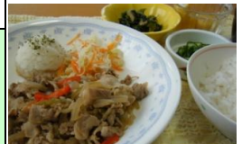
29日：豚肉の生姜焼き

※事前に食べ物の好みについても伺い、苦手な食材の献立の場合は違う料理を準備いたします。