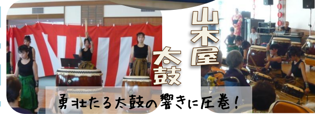
勇壮たる太鼓の響きに圧巻!