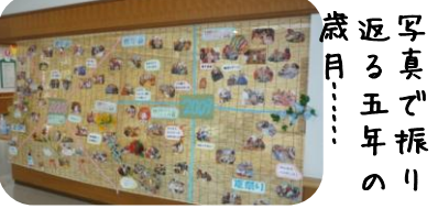
写真で振り返る五年の歳月……