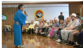
たっぷり楽しみました。